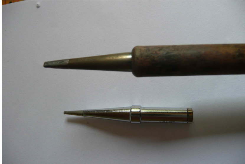
Abbildung 2: Geeignete Lötspitzen